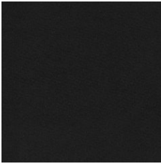
CAR PET 250 2021