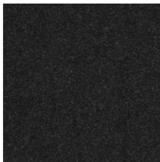
CAR PET 400 2206