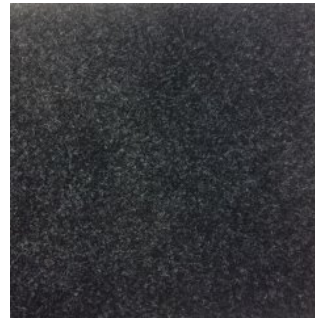
CAR PET 400 2251