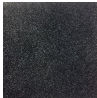
CAR PET 400 2251