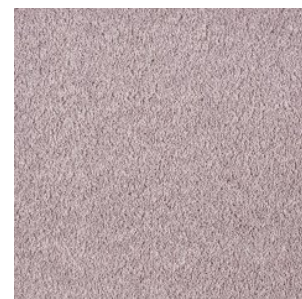
FAYE_H prem 854