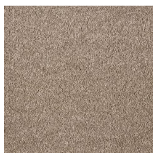
FAYE_H prem 334