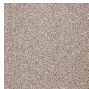
FAYE_H prem 396