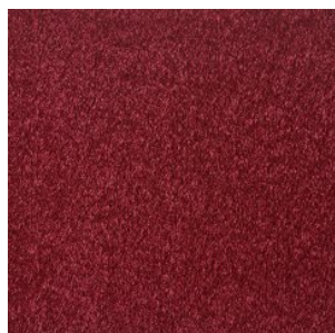
FAYE_H prem 445