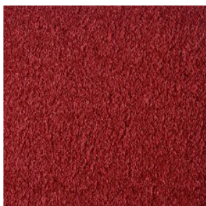
FAYE_H prem 440