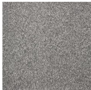
FAYE_H prem 151