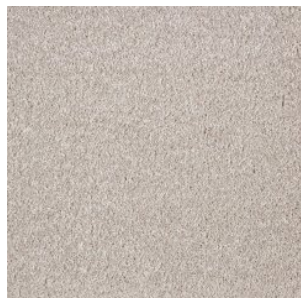
FAYE_H prem 110