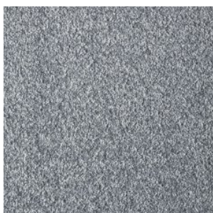
FAYE_H prem 884