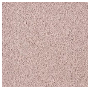
FAYE_H prem 457