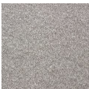
FAYE_H prem 156