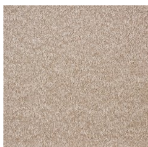
FAYE_H prem 305