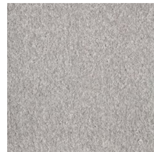
FAYE_H prem 152