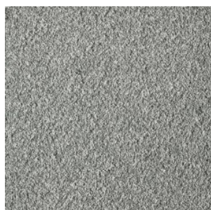
FAYE_H prem 894