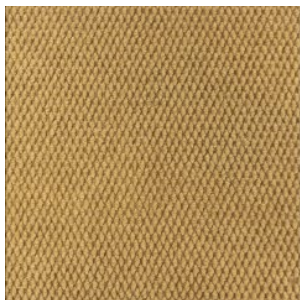
HONG KONG 1099