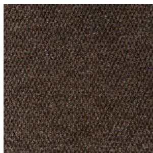
HONG KONG 7097