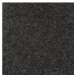
HONG KONG 2098