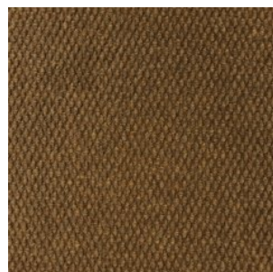
HONG KONG 7006