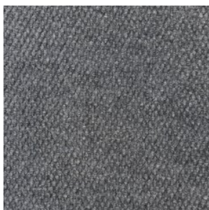
HONG KONG 2531