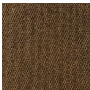
HONG KONG 1244