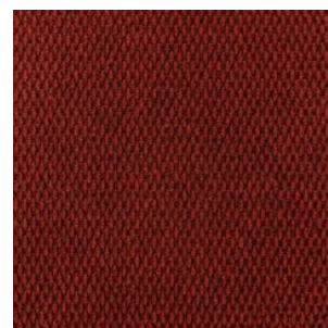
HONG KONG 3353