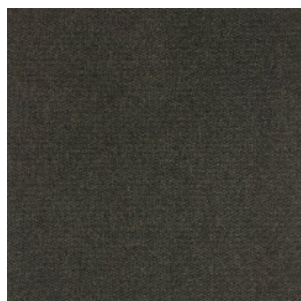
HONG KONG 6265