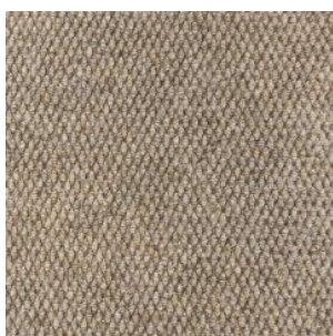
HONG KONG 1153