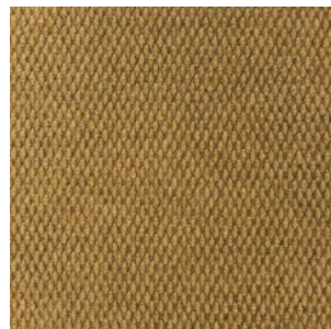
HONG KONG 1199