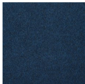
NEW ORLEANS 5546