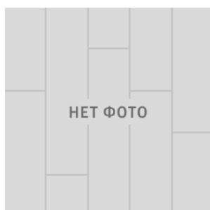
NEW ORLEANS 2285