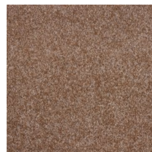
NEW ORLEANS 7764