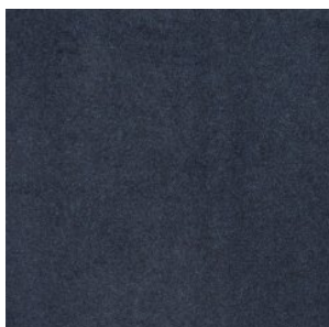
NEW ORLEANS 5507