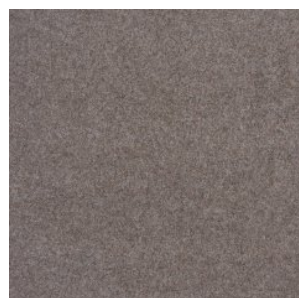
NEW ORLEANS 7760