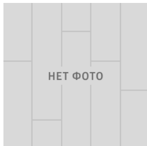
NEW ORLEANS 1761