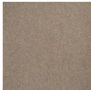
NEW ORLEANS 1770