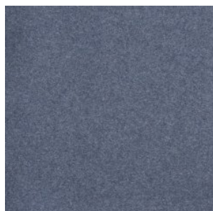
NEW ORLEANS 5539