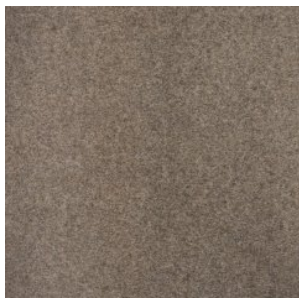
NEW ORLEANS 1142