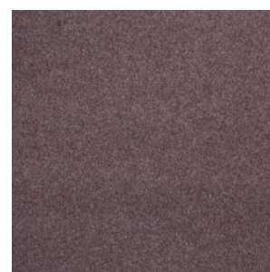
NEW ORLEANS 3372