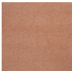
NEW ORLEANS 7719