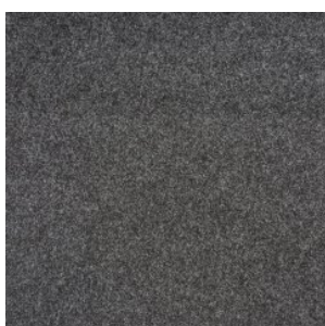
NEW ORLEANS 2236