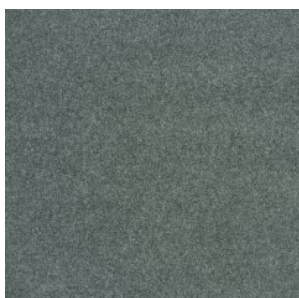
NEW ORLEANS 6672