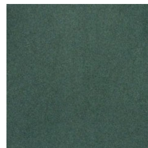
NEW ORLEANS 6652