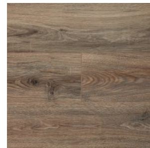
JT204 Дуб Лендава