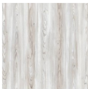
JT208 Сосна Изола

Изображения дизайнов могут отличаться от реальных образцов продукции в связи с особенностями цветопередачи полиграфического производства.