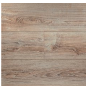
JT205 Дуб Коделли