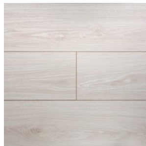
JT203 Дуб Грант