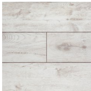
JT202 Ясень Копер