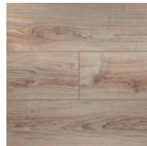
JT205 Дуб Коделли