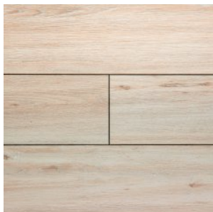
JT201 Дуб Идрийский