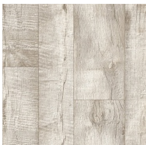
DANISH OAK 2

Ширина: 2,5/3/3,5/4 М Размерность дизайна: разная ширина x 100 см