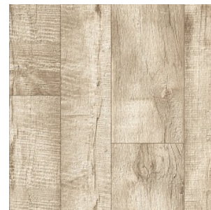
DANISH OAK 3

Ширина: 2,5/3/3,5/4 М Размерность дизайна: разная ширина x 100 см