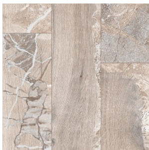
ELDER STONE 4

Ширина: 2,5/3/3,5/4 М Размерность дизайна: 16,6 x 100 см