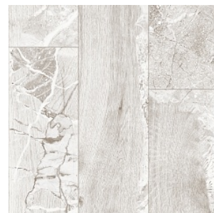
ELDER STONE 3

Ширина: 2,5/3/3,5/4 М Размерность дизайна: ∞ см