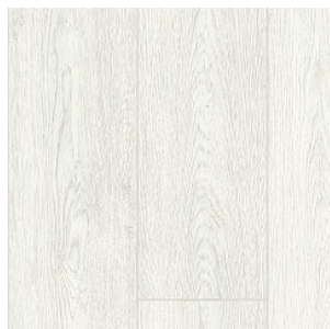
INDIAN OAK 8

Ширина: 2,5/3/3,5/4 М Размерность дизайна: 14,2 x 100 см