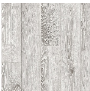
GOTICK OAK 5

Ширина: 2,5/3/3,5/4 М Размерность дизайна: 10 x 100 см