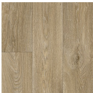
HAVANNA OAK 12

Ширина: 2,5/3/3,5/4 М Размерность дизайна: 16,6 x 150 см