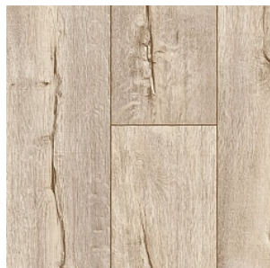
CRACKED OAK 1

Ширина: 5 М Размерность дизайна: 20 x 150 см