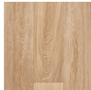
PURE OAK 1

Ширина: 5 М Размерность дизайна: 20 x 150 см