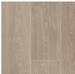
COLUMBIAN OAK 1

Ширина: 5 М Размерность дизайна: 20 x 150 см