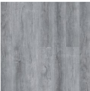
ДУБ ЭСКАЛИБУР 1582