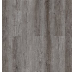
Дуб Камелот 1581