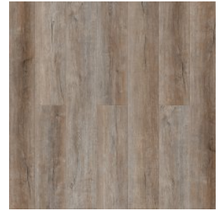
ДУБ КЕЛЬТСКИЙ 1583