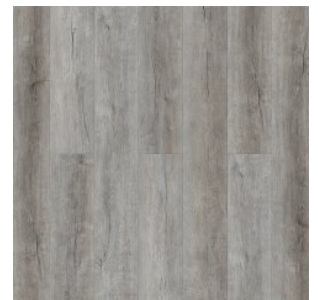
ДУБ ЭКТОР 1584