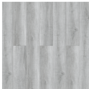
ДУБ МОРГАНА 1690