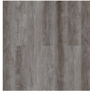
ДУБ КАМЕЛОТ 1581