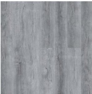
Дуб Эскалибур 1582