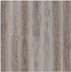
Дуб Арден 1588