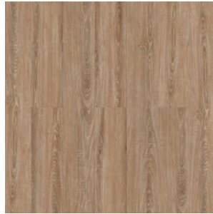
Дуб Валлийский 1586