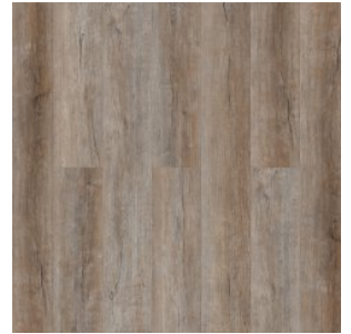
Дуб Кельтский 1583