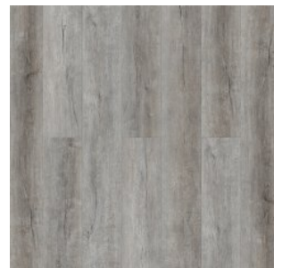
Дуб Эктор 1584