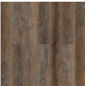
ДУБ КОРНУОЛЛ 1585