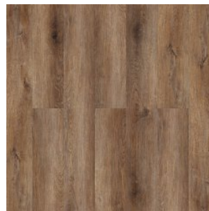
Дуб Рыцарский 1589