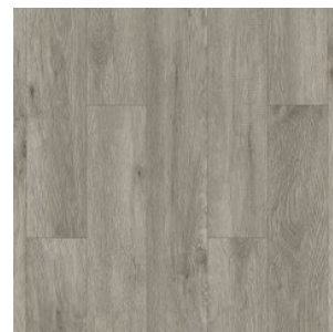
MILD GREY 5116