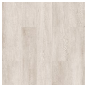
CHILLY WHITE 2851