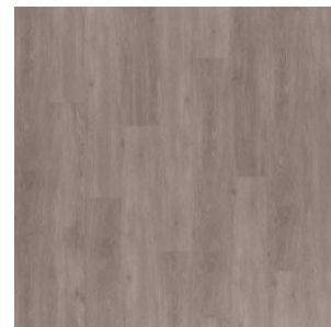
Mild Grey 5116