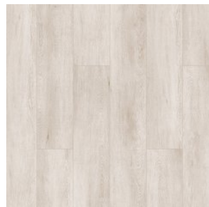
Chilly White 2851