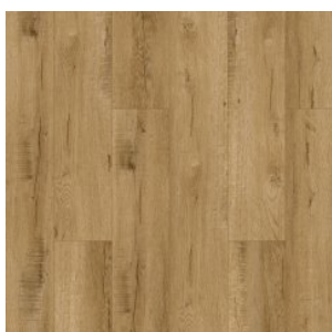
Timber Wood 1331

Изображения дизайнов могут отличаться от реальных образцов продукции в связи с особенностями цветопередачи полиграфического производства.