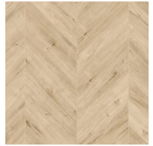
OAK GETTYSBURG 2016