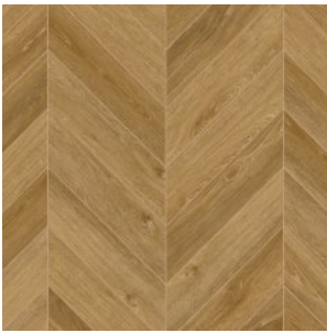
OAK MARENGO 2196