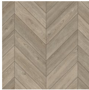
OAK MARNE 2195