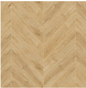
OAK WATERLOO 1010