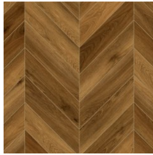
OAK AUSTERLITZ 1600