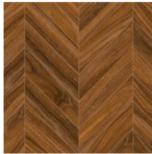
WALNUT AZINCOURT 8112

Изображения дизайнов могут отличаться от реальных образцов продукции в связи с особенностями цветопередачи полиграфического производства.