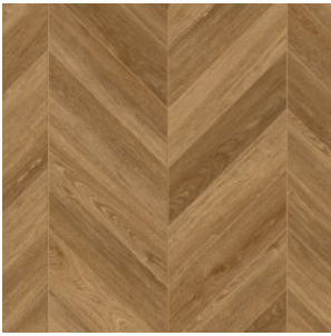
OAK ARDENNES 2197