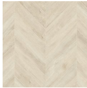
OAK SOMMA 8810