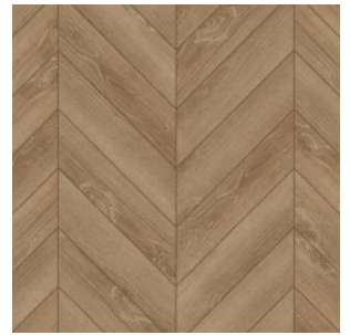
OAK VERDUN 2165