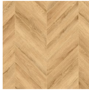
OAK DUNKIRK 8816