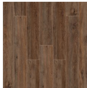
Дуб Ред-Рок 2004