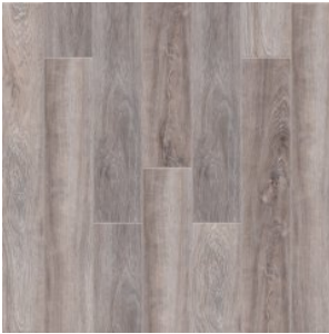
Дуб Аризона 2001