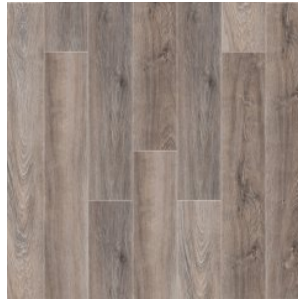
Дуб Вайоминг 2005