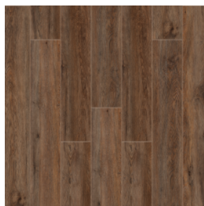
ДУБ РЕД-РОК 2004