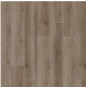
Дуб Чаннел 2008

Изображения дизайнов могут отличаться от реальных образцов продукции в связи с особенностями цветопередачи полиграфического производства.