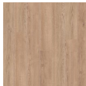
ДУБ СОНОРА 2010