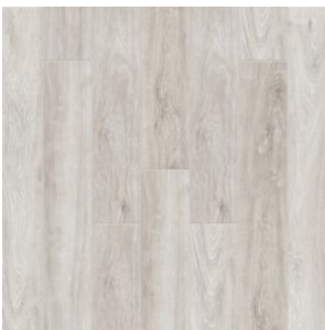
Дуб Навахо 2002