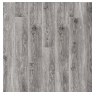
ДУБ МОХАВЕ 2009