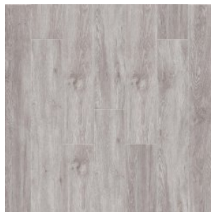
Дуб Огайо 2003