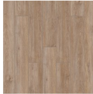
Дуб Йеллоустон 2006