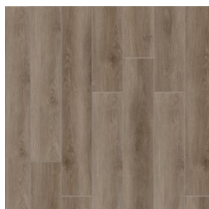
ДУБ ЧАННЕЛ 2008

Изображения дизайнов могут отличаться от реальных образцов продукции в связи с особенностями цветопередачи полиграфического производства.