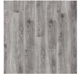
Дуб Мохаве 2009