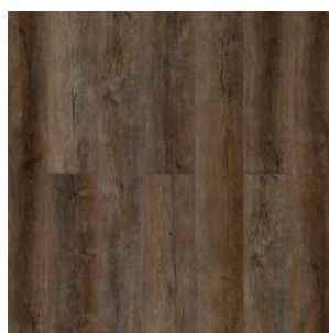
ДУБ ВИКТОРИЯ 3000