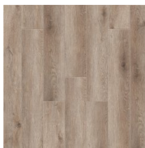
ДУБ ДИКСОН 3007