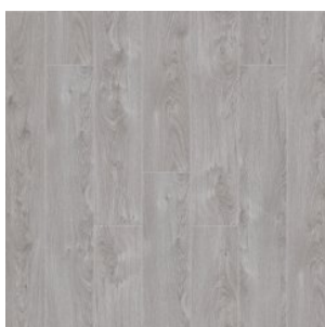
ДУБ МАЙЛИ 3009