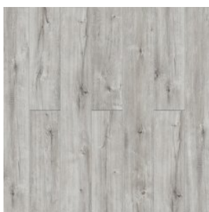
ДУБ ВЕСТФОННА 3006