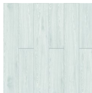
ДУБ КАЛЬДЕРОНЕ 3008