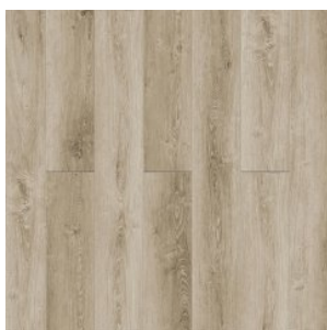
ДУБ ХАББАРД 3004