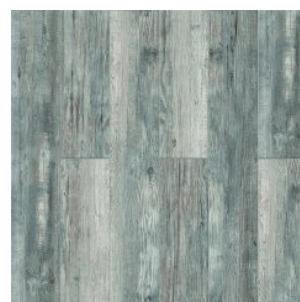
ДУБ ТАСМАНА 3003