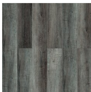
ДУБ ОСГОР 3002