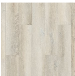
MIST OAK 5161-1513