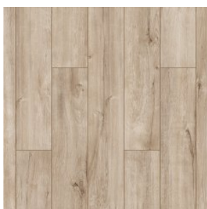
AUTUMN OAK 5161-8201