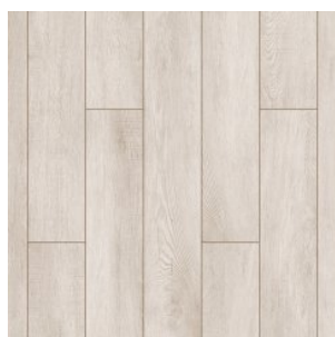
BLIZZARD OAK 5161-8821