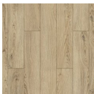
SUMMER OAK 5161-8808

Изображения дизайнов могут отличаться от реальных образцов продукции в связи с особенностями цветопередачи полиграфического производства.