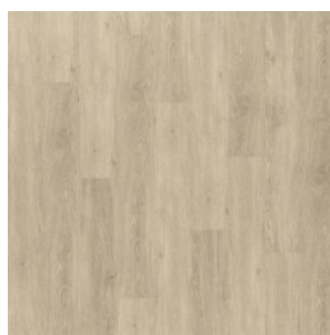
NEPAL GREY 5161-4036