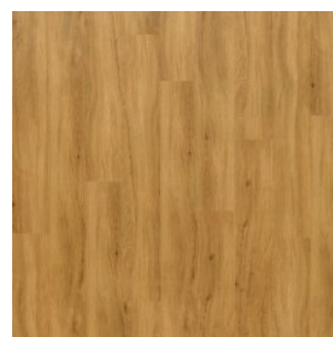
HONEY OAK 5161-4027