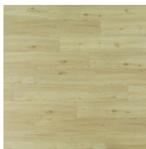
DESERT OAK 5161-4024