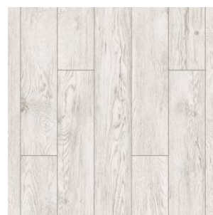
POLAR OAK 5161-1032