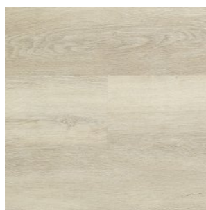
COSY NATURAL 1860