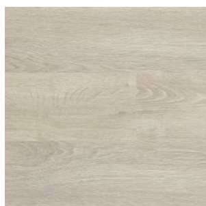
GRACE NATURAL 1215