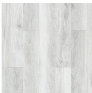
MOUNTAIN ICE 1536