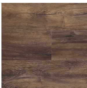
CANYON BROWN 1391