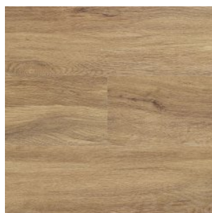
PALMER NATURAL 1301

Изображения дизайнов могут отличаться от реальных образцов продукции в связи с особенностями цветопередачи полиграфического производства.