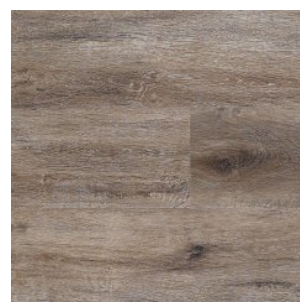
MOUNTAIN BROWN 1235