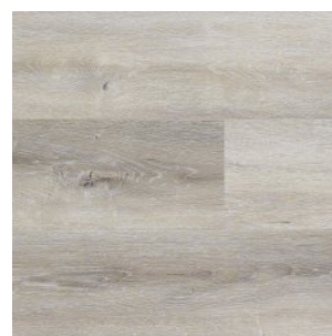
FRENCH LIGHT 1321