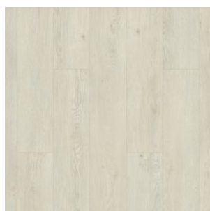
COLD RIVER 2912