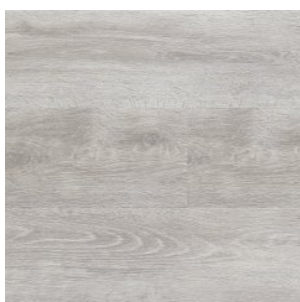
GRACE GREIGE 1216